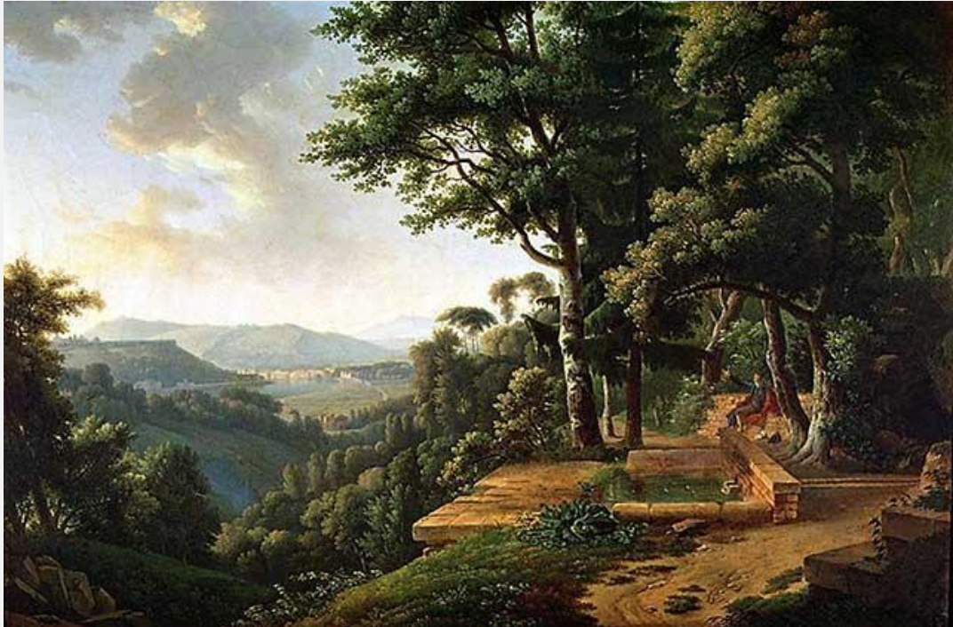
Rousseau a meditar no parque La Rochecordon